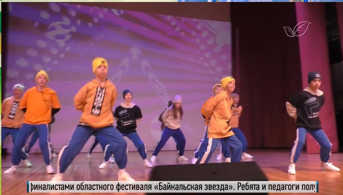
финалистами областного фестиваля «Байкальская звезда». Ребята и педагоги полу